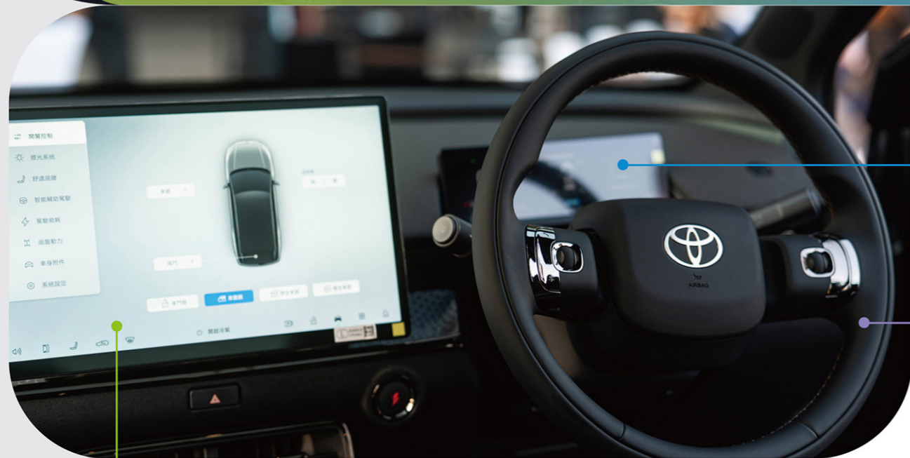
14.6吋輕觸式屏幕音響系統 連導航系統及無線Apple CarPlay